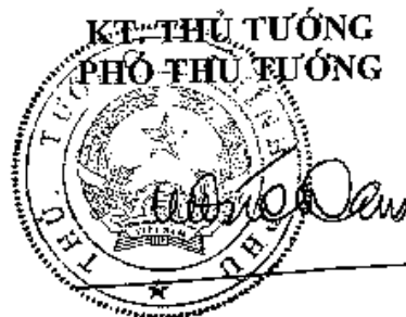
Vũ Đức Đam